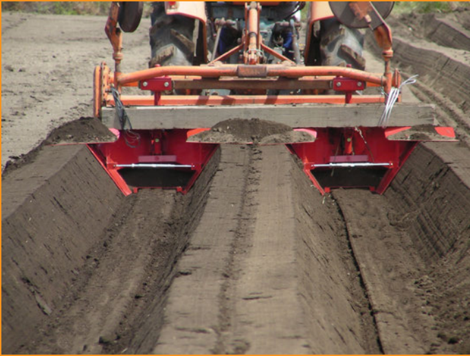
1. 深さ 270mm で、底面中央部に溝がない場合