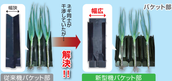
従来機バケット部