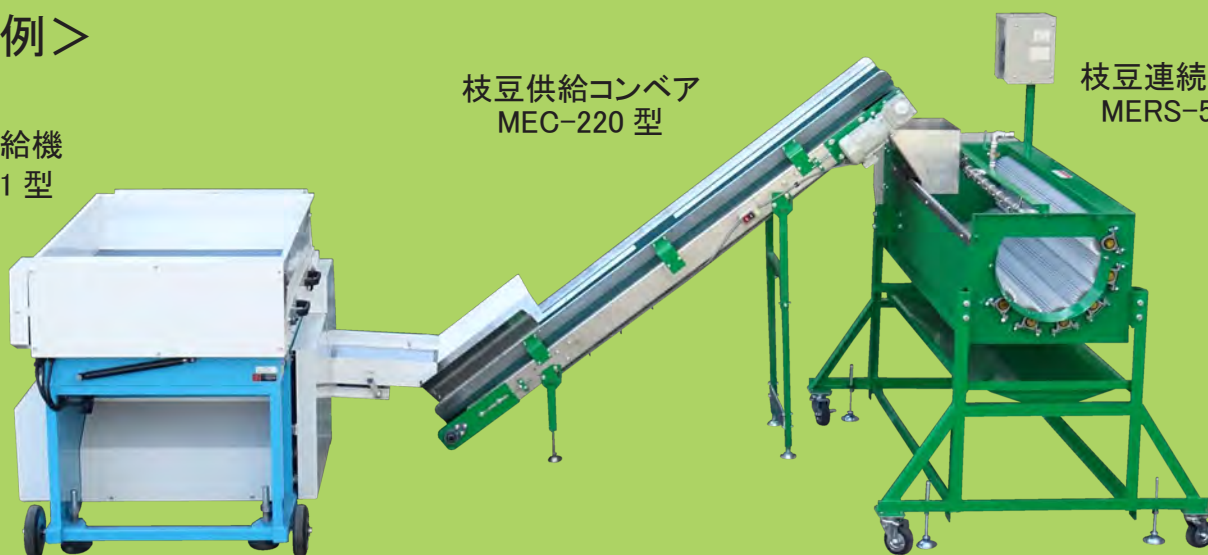
枝豆連続洗浄機 MERS-500 型